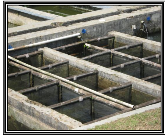
Gambar 1. Kolam Pemeliharaan Ikan Tengadak Albino dan Hitam