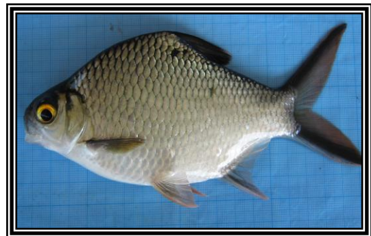
Gambar 3. Ikan tengadak hitam