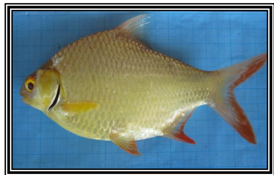
Gambar 2. Ikan tengadak albino