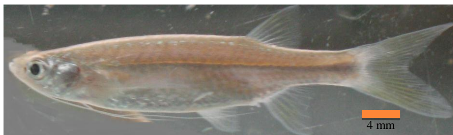
Gambar 2. Ikan pantau janggut ( Esomus metallicus )