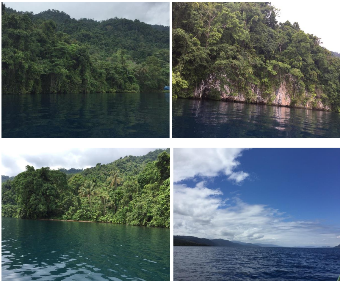
Gambar 3. Tampilan Danau Matano sebagai danau oligotrofik, dengan perairan sangat jernih yang dibatasi oleh dinding-dinding danau yang curam

Danau Matano diidentifikasi sebagai sumber utama kehadiran spesies - spesies endemik dalam kompleks danau-danau Malili (Haffner et al. 2001). Secara fisik Danau Matano memiliki keunikan di antaranya terjadi secara tektonik, berada pada ketinggian 396 m diatas permukaan laut (dpl), luas 164 km 2 dan kedalaman kurang lebih 590 m dan merupakan danau terdalam kedelapan di dunia. Danau Matano dideskripsikan oleh Haffner et al. (2001) sebagai danau oligotrofik, perairan sangat jernih dengan kecerahan mencapai >20 m, daerah litoral relatif sempit yang dibatasi oleh dinding-dinding danau yang curam. Tampilan kondisi Danau Matano tahun 2019, dapat dilihat pada Gambar 3.