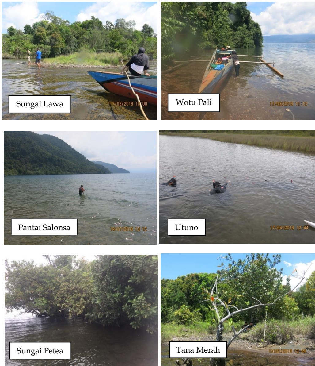
Gambar 2. Habitat ikan opudi tersebar di daerah litoral, terbuka pada perairan yang jernih

Habitat ikan opudi tersebar di daerah litoral dan umumnya di daerah terbuka pada perairan yang jernih dan dangkal pada kedalaman kurang lebih 0,5 m (Soeroto et al. 2004), sampai dengan 10 m (Gray and McKinnon 2006). Selain itu, habitat yang memiliki vegetasi tumbuhan juga merupakan daerah yang disenangi oleh ikan tersebut (Herder and Schliewen 2010). Habitat ikan opudi yang tertangkap dalam penelitian tahun 2019, terdapat pada enam lokasi, seperti terlihat pada Gambar 2.